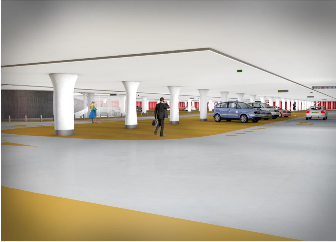
Foto-onderschrift: Impressie van de parkeergarage Jaarbeursplein Bron: Witteveen+Bos – Zwarts & Jansma Architecten

In de komende maanden zal de uitvoering worden voorbereid, zodat begin januari 2016 de bouw van de garage daadwerkelijk kan starten. In 2018 wordt de Jaarbeurspleingarage tegelijk met het bovenliggende plein opgeleverd.