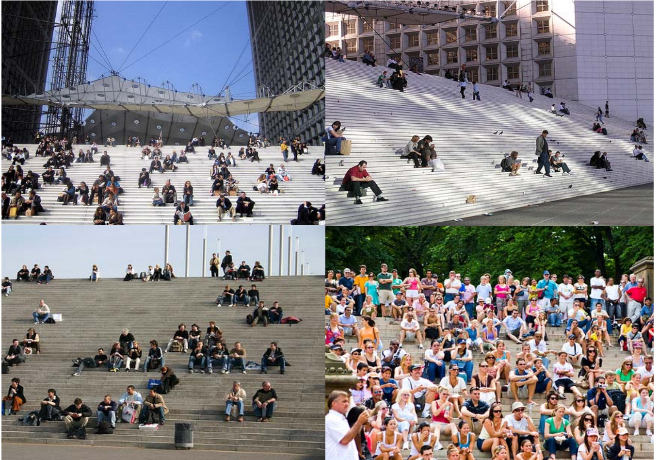
Referentiebeeld trappenpartij Stationsplein West als tribune