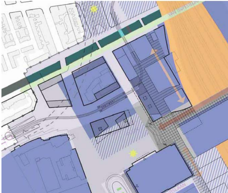
Afbeelding: Mogelijke afwijkingen Structuurplan.